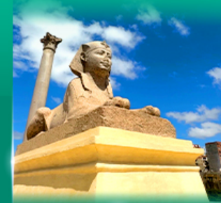
เสาริมนปอมเปย์