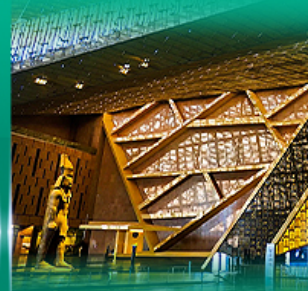
พิพิธภัณฑ์แกรนด์อียิปต์ (GEM)