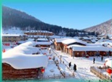
หมู่บ้านหิมะ สโนว์ทาวน์