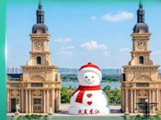
ตึกตาสหิมะยักษ์ ฮาร์บิน