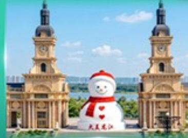
ตุ๊กตาหิมะยักษ์ ฮาร์บิน