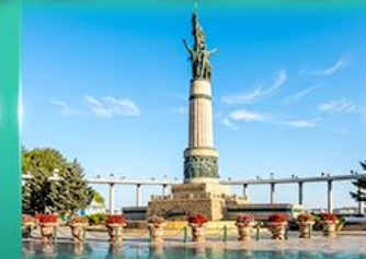
อนุสาวรีย์มังกร