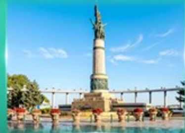
อนุสาวรีย์นิ่มพพ