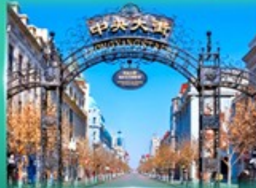
ย่านจงหยาง สตรีท