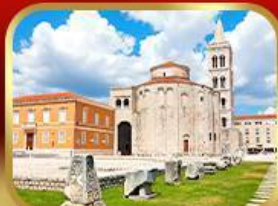
โบสถ์เซนต์โทมัส ซาตาร์