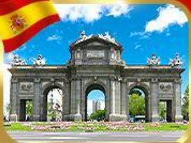
เขikin ประตูอัลกาลา มาดริด