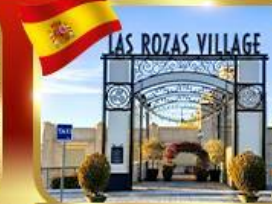
Las Rozas Village อากัลเลี่ยน