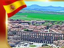
เที่ยวเมืองมรดกโลก เซโกเวีย