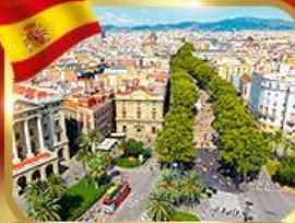
ลาร์มบลาสตริก บาร์เซโลนา