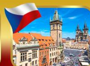
ชมวิวยุทธศาสตร์เมืองปราก