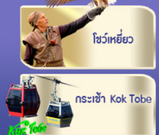
โชว์เหยี่ยว