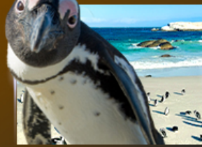
Simon's Town ชมฝูงเพนกวิน