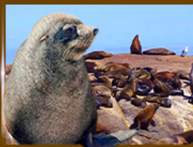
ส่องเรือชมฝูงแมวน้ำ Seal Island