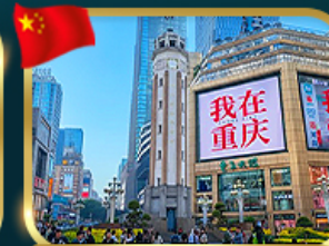
ถนนคนเดินเจียงฟางเป่ย์