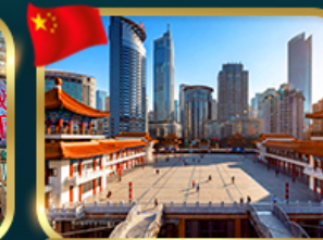
เขาคอนตึ๊งไคว่ซังไหล