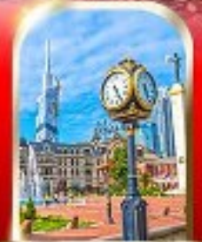
BATUMI CITY ADJARA

เมืองถ้ำอูพลิสซิค ■ ป้อมออบูซี ■ นั่งกระเช้าชมเมืองบอร์โจมี