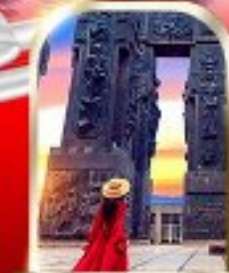
THE CHRONICLE OF GEORGIA