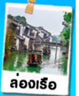
ล่องเรือ