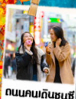
ถนนคนกินชุนซ์