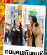
ถนนคนเดินชุนซี