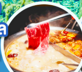
ชาบูหม่าล่า