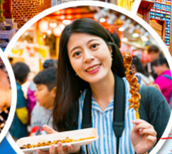
ตลาดควางจ้ง