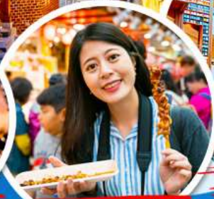
- ตลาดควางจั้ง