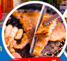
นมูย่างเกาหลี