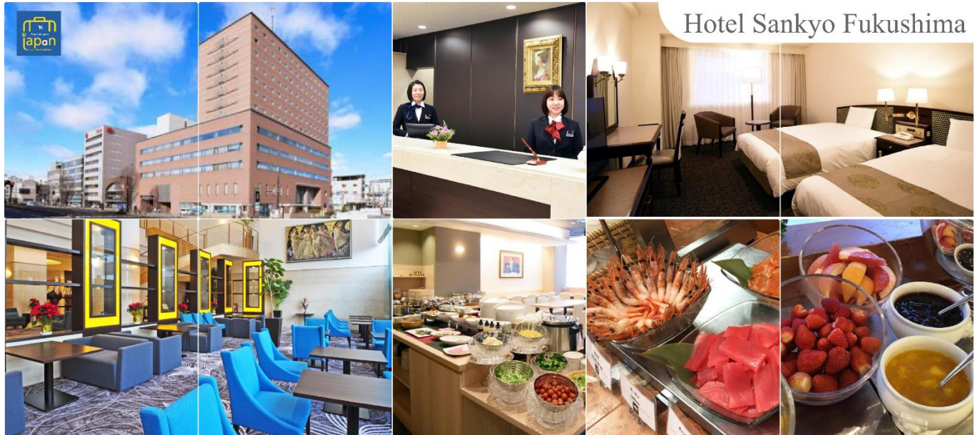
Hotel Sankyo Fukushima

พักที่ HOTEL SANKYO FUKUSHIMA หรือเทียบเท่าระดับเดียวกัน