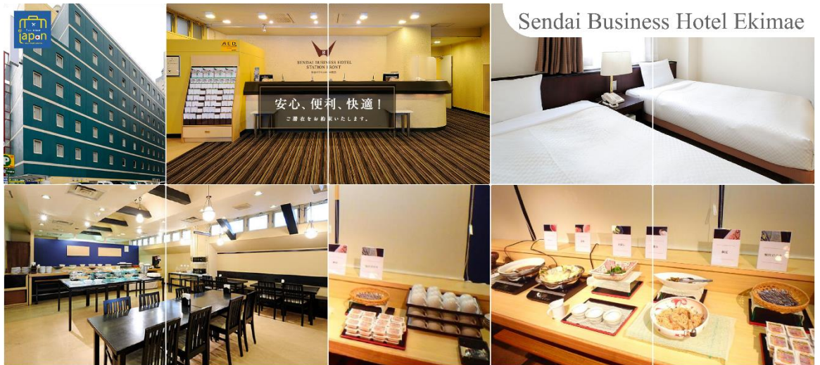
Sendai Business Hotel Ekimae

วันที่หก ทำอากาศยานเซนได – ทำอากาศยานนานาชาติเกาหยวน – ทำอากาศยานสุวรรณภูมิ