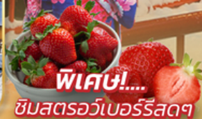
พิเศษ!... ชิมสตอว์เบอร์รีสดๆ

ไฮไลท์!! สัมผัสความงามของ กินซันออนเซ็น อันเลื่องชื่อ สองเรือชมอ่าวมัตสึชิมะ ชมหมู่บ้านเกะน้อยใหญ่บนอ่าวกว่า 100 เกาะ ชมหมู่บ้านโบราณ โออุจิ จุกุ พร้อมลิ้มลองอาหารท้องถิ่น "โซะ-ต้นหอม" เฟลิดเพลิน เก็บสตอเบอร์รี สดๆจากต้น ผ่อนคลายกับการแช่ ออนเซน