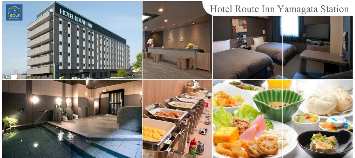
Hotel Route Inn Yamagata Station

วันที่ห้า เมืองยามากาตะ – เมืองเซนได – ไร่สวนสตอเบอร์รี่ – ดิวตี้ฟรี – ซากปราสาทเซนได – ถนนคิลิสโรด