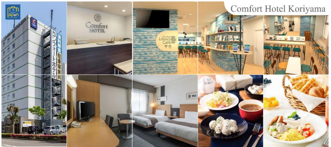
Comfort Hotel Koriyama

รับประทานอาหารเย็น ณ ภัตตาคาร (1) COMFORT HOTEL KORIYAMA หรือระดับเดียวกัน