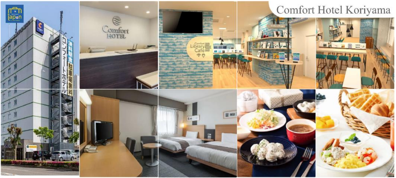
Comfort Hotel Koriyama

เย็นพักที่ อิสระรับประทานอาหารเย็นตามอัธยาศัย COMFORT HOTEL KORIYAMA หรือระดับเดียวกัน