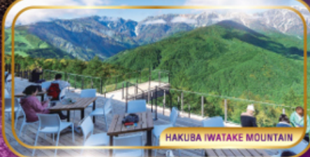
HAKUBA IWATAKE MOUNTAIN