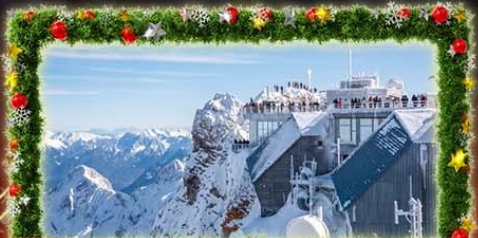
พีชิต Zugspitze Top Of Germany

สัมผัสนที่สุดแห่ง CHRISTMAS MARKET 2026 เทศกาลแห่งความสุขที่สุดแห่งปี