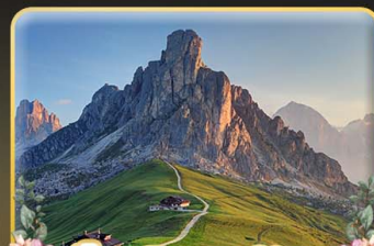
เขื่อน Passo Giau