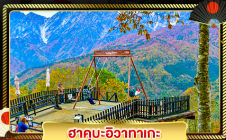
ฮาคุบะอิซากาเตะ