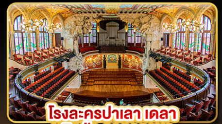
โรงละครปาเลา เดลา มูสิกา คาทาลานา