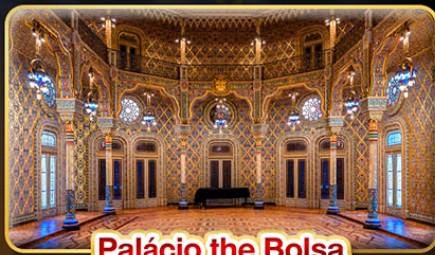
Palácio the Bolsa

📅 เดินทาง : 9 - 18 ต.ค. | 30 พ.ย. - 9 ธ.ค. 69