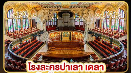
โรงละครปาเลา เดลา มูสิคก้า คาทาลานา