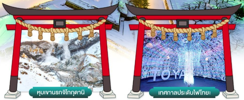
หุบเขานรกจิโกกุคานิ