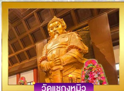
วัดแซงกงหมิว