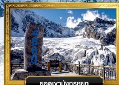
ยอดเขามังกรหยก