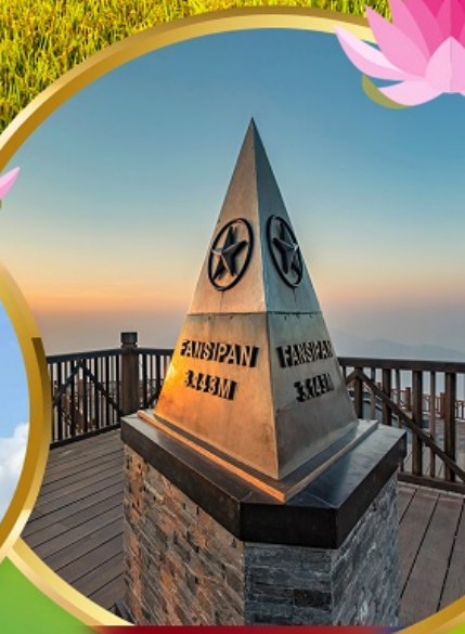
ฟานชิปัน