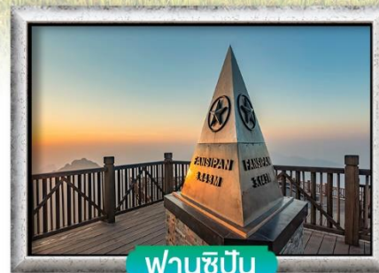
ฟานชีปัน