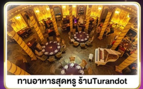
ทานอาหารสุดหรู ร้านTurandot