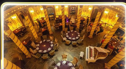
ทานอาหารสุดหรู ภัตตาคาร Turandot