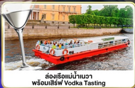
ล่องเรือแม่น้ำแคว พร้อมเสิร์ฟ Vodka Tasting