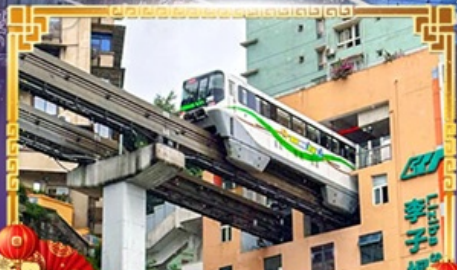
รถไฟฟ้า-ลูตึก