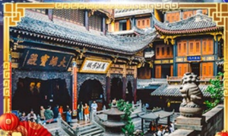
วัดหลิวทาน