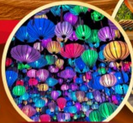
สวนแห่งแสง (Lumiere Light Garden)