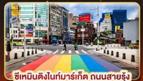
ซีเหมินติงในท่งมาร์เก็ต ถนนสายรุ้ง