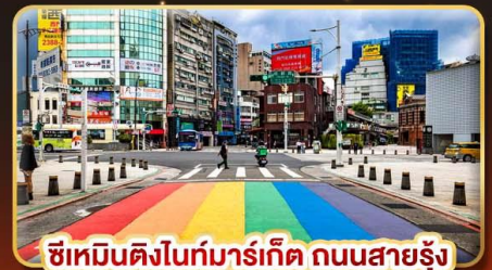
ซีเหมินตงไนท์มาร์เก็ต ถนนสายรุ้ง