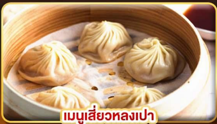
แมบูสี่วทลงเปา

แม่บ้านโบราณ จิวเฟิน ช้อปปังจุใจ 3 ตลาดกลางคีนช้อดง