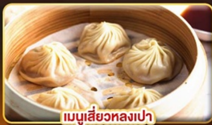
เมนูเสี่ยวหลงเปา

หมู่บ้านโบราณ จิวเฟิ่น ช้อปปิ้งใจ 3 ตลาดกลางคืนชื่อดัง