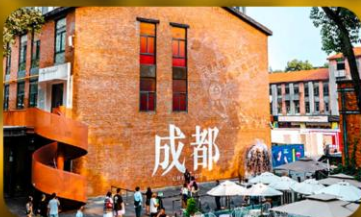
ดงเจียวจี้