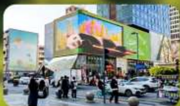
ไท่กุ๋หลี่