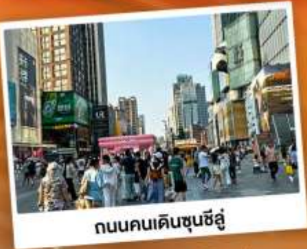
ถนนคนเดินชุนชี่อู่