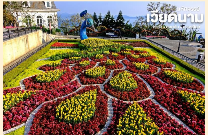
ปัทมาภรณ์ เวียดนาม คาบัง • ฮอยอัน • ไซปารีส

ชมเมืองฝรั่งเศส เป็นตึกออกแบบมาได้ บรรยากาศยุโรปแท้ๆแต่มาเจอได้ใกล้ๆ เพียงแค่เวียดนาม ลัดเลาะไปตามตรอก ซอกซอย มีมุมถ่ายรูปเซ็กซี่อินสวยๆหลาย มุม Le Jardin d' Amour เป็นสวนสวย สไตล์ฝรั่งเศส ที่มีทั้งดอกไม้ต้นไม้ มีมุม ถ่ายรูปสวยๆ เต็มไปหมด รวมไปถึงมี โรง ไวน์ Debay Wine Cellar ด้านในจะเป็น คล้ายๆ อุโมงค์ใต้ดินไวน์บ่มไวน์ เป็นทางยาวเดินทะเลชุ่มไปเรื่อยๆ ก็จะออกมาที่สวน นอกจากนี้