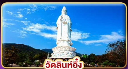
วัดลินห์ฮอ้ง