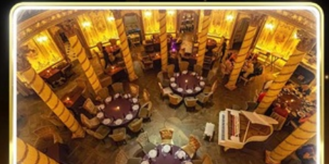
ทานอาหารสุดหรู ภัตตาคาร Turandot