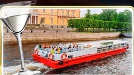
ส่องเรือแม่น้ำเนวา พร้อมเสิร์ฟ Vodka Tasting