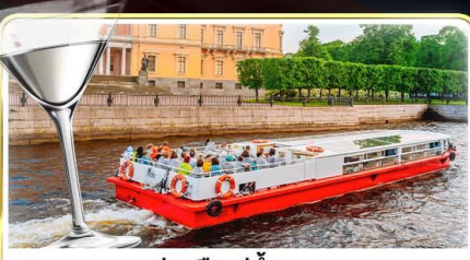
ส่องเรือแม่น้ำแคว พร้อมเสิร์ฟ Vodka Tasting