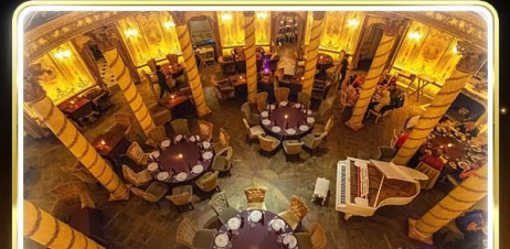
ทานอาหารสุดหรู ร้านTurandot