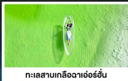
ทะเลสาบเกลือฉาเออร์อัน