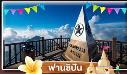
ฟานชิปัน