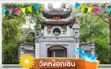
วัดหิ่งกัซัน