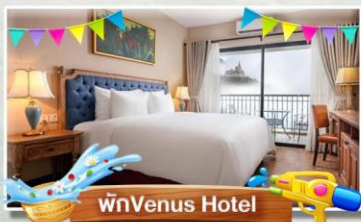
พนัก Venus Hotel