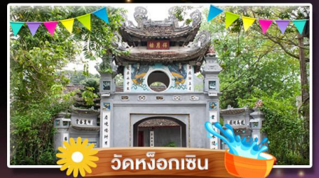
วัดห่งอกเซิน