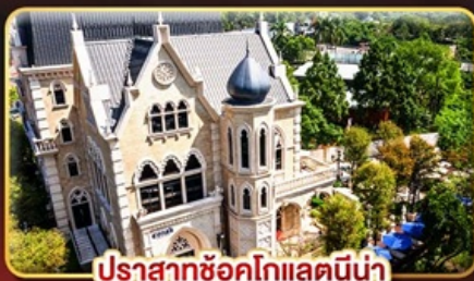
ปราสาทช็อคโกแลตน้ำ