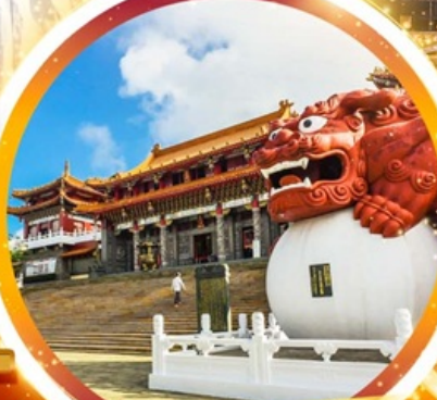
วัดหวินหฺวู่