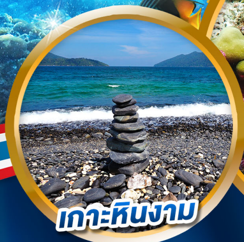
เกาะหินงาม