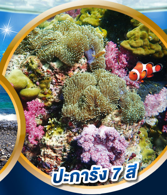
ปะการัง 7 สี