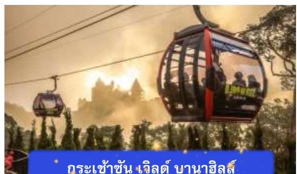
กระเช้าชั้น เวิลด์ บานาฮิลล์