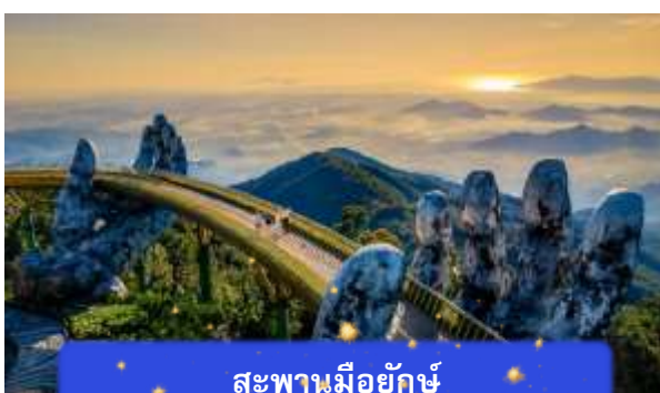
สะพานมียักษ์

เที่ยง อีศระอาหารกลางวันเพื่อความสะดวกในการท่องเที่ยว