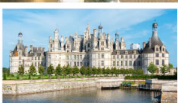
เข้าชมพระราชวังซ็องบอร์