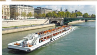
ล่องเรือแม่น้ำแชนน์