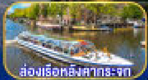
ล่องเรือหลังคากระเจก