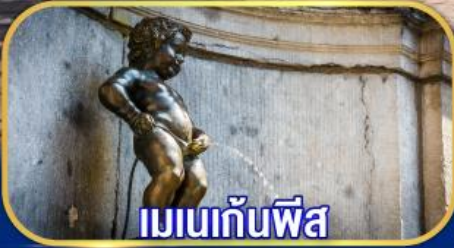
เมเนกันพีส