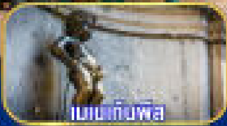
เบเนทท์พิล