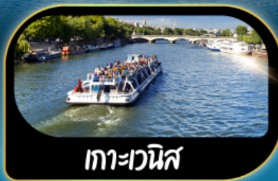
กาทะเวนิส