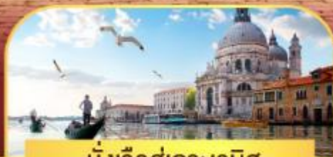
นั่งเรือสุทเกาะเวนิส