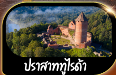
ปราสาททุโรต้า

GO3HEL-EK001 28 ธ.ค.69 - 07 ม.ค.70 เทศกาลปีใหม่