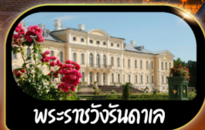
พระราชวังรันดาค