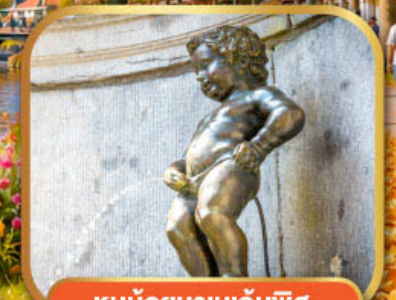
หนูน้อยมานเกินพิส