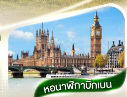
หอนาฬิกาบิกเบน