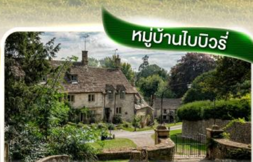
หมู่บ้านไบบิวรี่