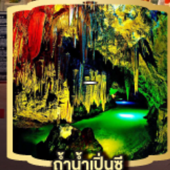
ถ้ำน้ำเป่ย์ซี