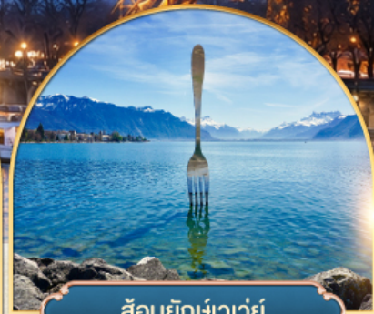
ล้อมยักซ์เวอว์