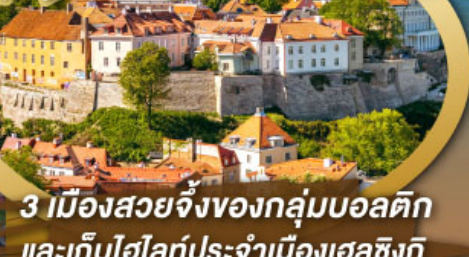
3 เมืองสวยจิ่งของกลุ่มบอลติก และเก็บไฮไลท์ประจำเมืองเฮลซิงกิ และล่องเรือเฟอร์รี่ข้ามประเทศ

ไฮไลท์ในโปรแกรม • เที่ยวสามประเทศหลักกลุ่มบอลติก • ชมเมืองหลวงวิลนิอุส ประเทศลัตเวีย