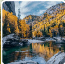
เคนเคอทัวให้อัจฉรัยภูพาน