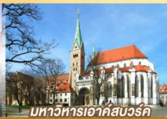
มหาวิหารเอาก์สเวิร์ค