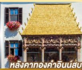
หลังคาทองคำอินน์ส์บรุค