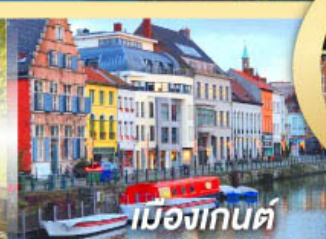
เมืองเกนต์