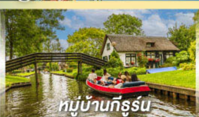
หมู่บ้านทีร์รูน